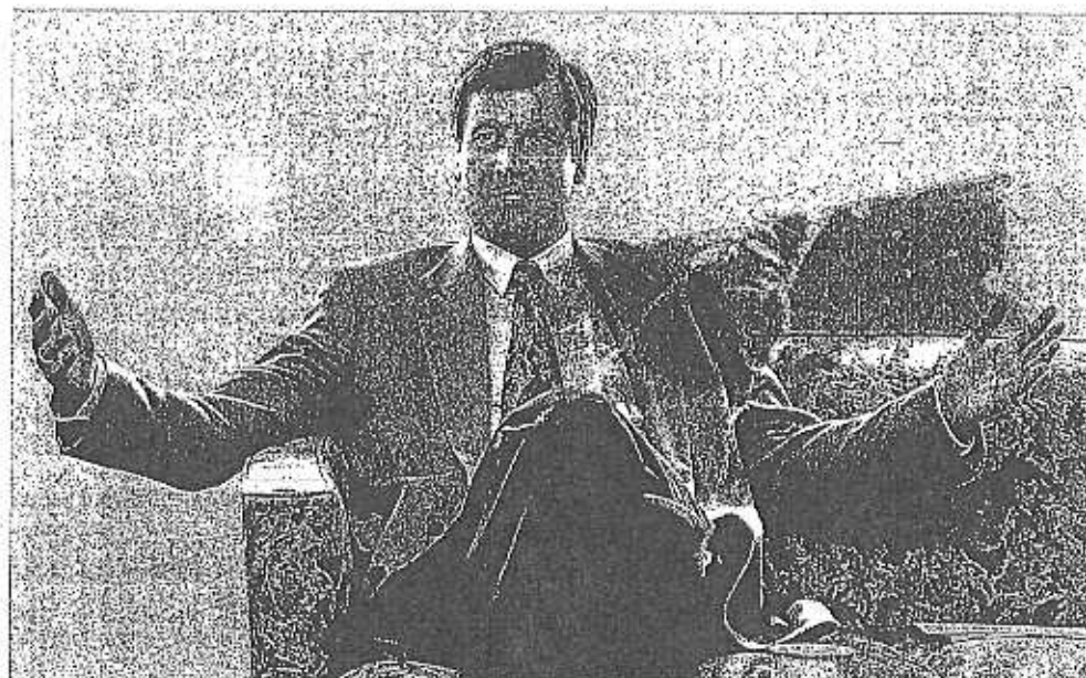
Reformer Seehofer: „Wo beginnt die Verantwortung des einzelnen?“